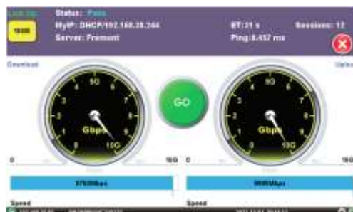
Speed Test 10Gbps