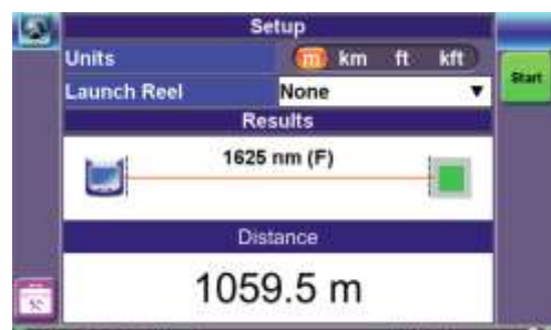
フォルトロケータ(距離レンジ 10m~20Km)